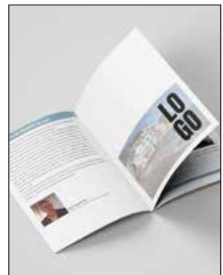
½ Pg. publicitat Programa