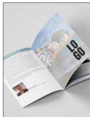
Pg. publicitat Programa