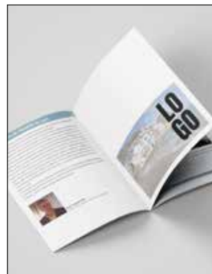
½ Pg. publicitat Programa